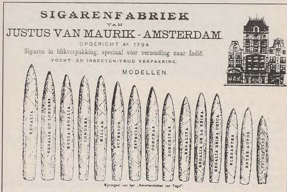
Reclame van de Sigarenfabriek van Justus van Maurik in Amsterdam

Een andere bekende kerverij en later sigarenfabriek was die van Justus van Maurik. Begonnen in 1794 in de Warmoesstraat en enkele jaren later verhuisd naar het Damrak 68. Het pand bestaat nog steeds, al zult u moeite hebben het te herkennen naast de grote buurman C&A.